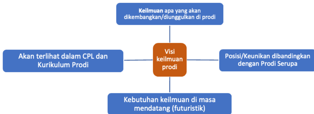
Gambar 3. Pengembangan visi keilmuan program studi