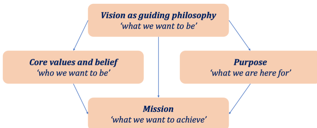
Gambar 1. Framework Visi

Gambaran masa depan dari sebuah institusi atau organisasi atau Lembaga yang diyakini akan terjadi menurut pandangan stakeholder internal dan eksternal dari perguruan tinggi. Visi akan berisi pernyataan tentang cita-cita yang diinginkan di masa depan. Rumusan visi harus menunjukkan ke arah mana institusi akan dibawa dan seperti apa institusi tersebut bila telah sampai di tujuan. Program studi harus memetakan keilmuan apa yang akan dikembangkan di masa yang akan datang, selain itu visi keilmuan harus memiliki keunikan yang menjadi penciri program studi dibandingkan dengan program studi sejenis di Perguruan Tinggi lainnya.