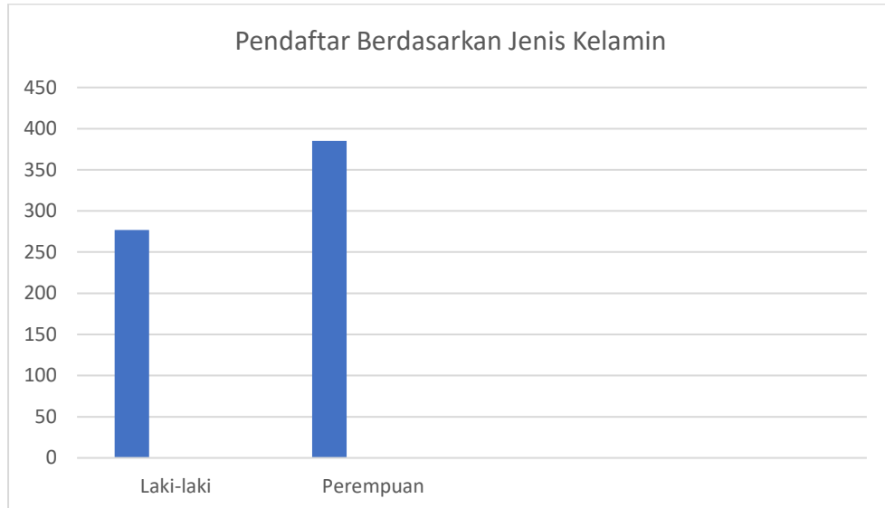
Gambar 1. Pendaftar berdasarkan jenis kelamin

UMS membuka akses seluas-luasnya kepada masyarakat untuk dapat melaksanakan pendidikan dengan mempertimbangkan kualitas, keadilan, pemerataan, dan keseimbangan. Keadilan, mempertimbangkan prinsip meritokrasi dan memberikan akses yang sama bagi calon mahasiswa yang berkualitas namun kurang mampu secara ekonomi atau memberikan akses bagi disabilitas maupun bagi yang beragama non Islam. Pemerataan, memperhatikan sebaran daerah asal, tidak bias gender. Pada tahun 2020 terdapat 662 pendaftar di Prodi Pendidikan Matematika dengan jumlah pendaftar laki-laki sebanyak 277 (41,84%) dan perempuan sebanyak 385 (58,16%). Dari pendaftar tersebut, terdapat 312 pendaftar yang lulus seleksi dan 180 pendaftar yang melakukan registrasi.