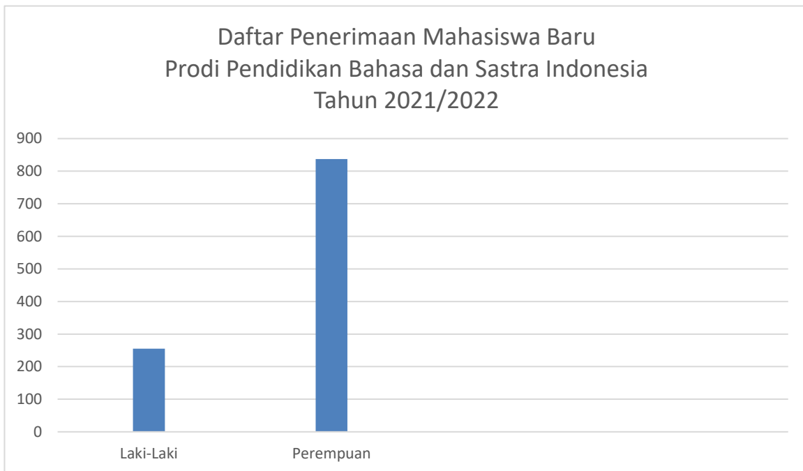
Gambar 1. Pendaftar Berdasarkan Jenis Kelamin

UMS membuka akses seluas-luasnya kepada masyarakat untuk dapat melaksanakan pendidikan dengan mempertimbangkan kualitas, keadilan, pemerataan, dan kesinambungan. Keadilan, mempertimbangkan prinsip meritokrasi dan memberikan akses yang sama bagi calon mahasiswa yang berkualitas namun kurang mampu secara ekonomi atau memberikan akses bagi disabilitas maupun bagi beragama non Islam. Pemerataan, memperhatikan sebaran daerah asal, tidak bisa gender. Pada tahun 2021 terdapat 1093 pendaftar di Prodi Pendidikan Bahasa dan Sastra Indonesia dengan jumlah pendaftar laki-laki sebanyak 256 (23.42%) dan perempuan sebanyak 837 (76.57%). Dari pendaftar tersebut, terdapat 243 pendaftar yang lulus seleksi dan 163 pendaftar yang melakukan registrasi.