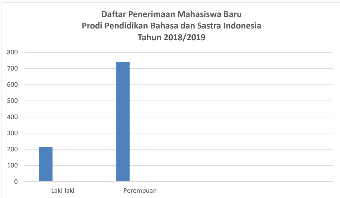
Gambar 1. Pendaftar Berdasarkan Jenis Kelamin

UMS membuka akses seluas-luasnya kepada masyarakat untuk dapat melaksanakan pendidikan dengan mempertimbangkan kualitas, keadilan, pemerataan, dan kesinambungan. Keadilan, mempertimbangkan prinsip meritokrasi dan memberikan akses yang sama bagi calon mahasiswa yang berkualitas namun kurang mampu secara ekonomi atau memberikan akses bagi disabilitas maupun bagi beragama non Islam. Pemerataan, memperhatikan sebaran daerah asal, tidak bisa gender. Pada tahun 2018 terdapat 955 pendaftar di Prodi Pendidikan Bahasa dan Sastra Indonesia dengan jumlah pendaftar laki-laki sebanyak 213 (22,30%) dan perempuan sebanyak 742 (77,70%). Dari pendaftar tersebut, terdapat 294 pendaftar yang lulus seleksi dan 208 pendaftar yang melakukan registrasi.