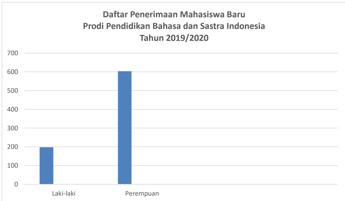
Gambar 1. Pendaftar Berdasarkan Jenis Kelamin

UMS membuka akses seluas-luasnya kepada masyarakat untuk dapat melaksanakan pendidikan dengan mempertimbangkan kualitas, keadilan, pemerataan, dan kesinambungan. Keadilan, mempertimbangkan prinsip meritokrasi dan memberikan akses yang sama bagi calon mahasiswa yang berkualitas namun kurang mampu secara ekonomi atau memberikan akses bagi disabilitas maupun bagi beragama non Islam. Pemerataan, memperhatikan sebaran daerah asal, tidak bisa gender. Pada tahun 2017 terdapat 802 pendaftar di Prodi Pendidikan Bahasa dan Sastra Indonesia dengan jumlah pendaftar laki-laki sebanyak 198 (24,69%) dan perempuan sebanyak 604 (75,31%). Dari pendaftar tersebut, terdapat 337 pendaftar yang lulus seleksi dan 256 pendaftar yang melakukan registrasi.